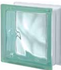
VERDE Q19 O 19x19x8