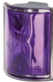
INDACO ANGOLARE O MET 19x15,2x8