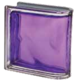
INDACO TER LINEARE O MET 19x19x8