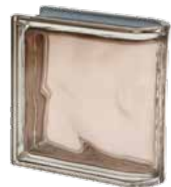
TORTORA TER LINEARE O MET 19x19x8