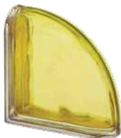
CEDRO TER CURVO O MET 19x19x8