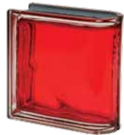
SCARLATTO TER LINEARE O MET 19x19x8