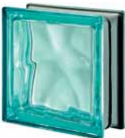
TURCHESE Q19 O MET 19x19x8