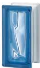
BLU R09 O 19x9,4x8