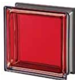
RUBINO Q19 T MET 19x19x8