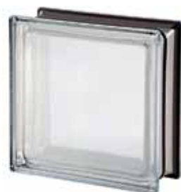
WHITE 30% Q19 T MET 19x19x8