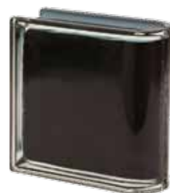
NERO TER LINEARE O MET 19x19x8