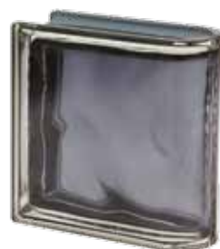
ARDESIA TER LINEARE O MET 19x19x8