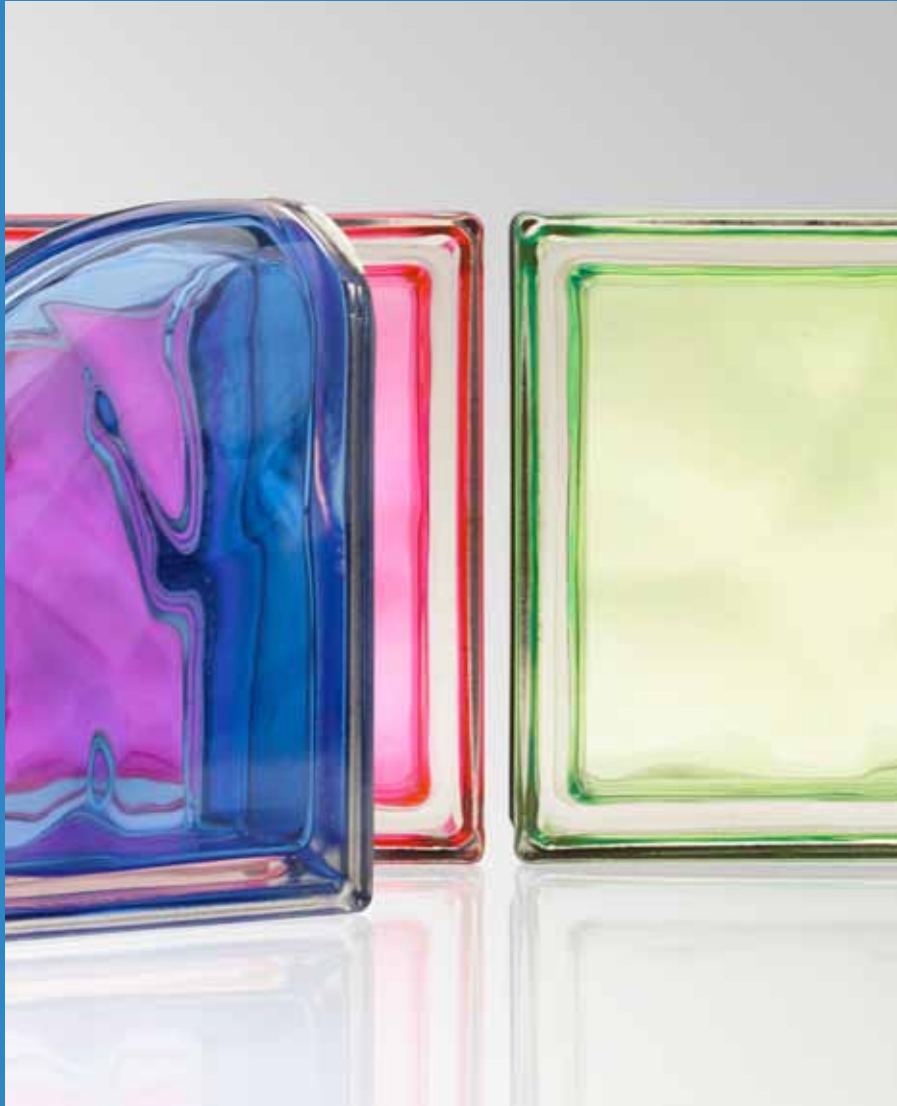
NEW COLOUR COLLECTION COBALTO TER CURVO O MET / MAGENTA Q19 O MET / KIWI Q19 O MET