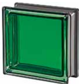
GIADA Q19 T MET 19x19x8