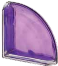
INDACO TER CURVO O MET 19x19x8