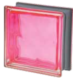
MAGENTA Q19 O MET 19x19x8