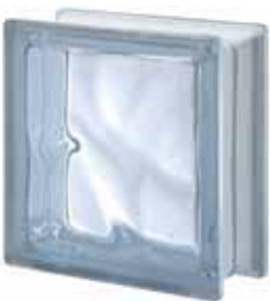
LILLA Q19 O 19x19x8