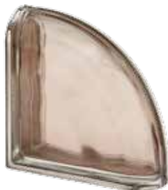
TORTORA TER CURVO O MET 19x19x8