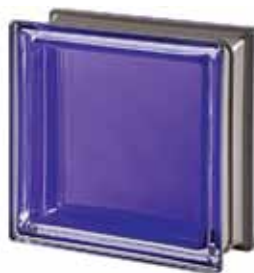
AMETISTA Q19 T MET 19x19x8