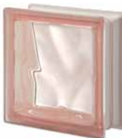
ROSA Q19 O 19x19x8