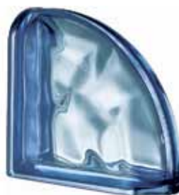
BLU TER CURVO O MET 19x19x8