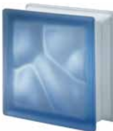
BLU Q19 O SAT 19x19x8