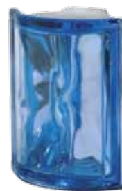
BLU ANG O MET 19X15,2X8