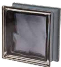
ARDESIA Q19 O MET 19x19x8