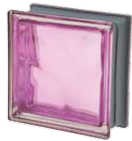
MALVA Q19 O MET 19x19x8