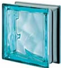
ACQUAMARINA Q19 O MET 19x19x8