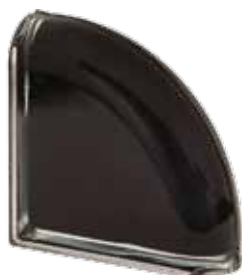
NERO TER CURVO O MET 19x19x8