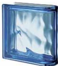
BLU TER LINEARE O MET 19X19X8