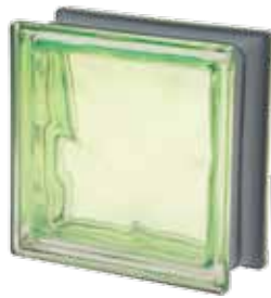
MUSCHIO Q19 O MET 19x19x8