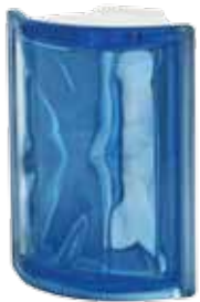
BLU ANG O 19x15,2x8