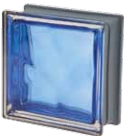
COBALTO Q19 O MET 19x19x8