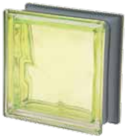
KIWI Q19 O MET 19x19x8