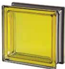
CITRINO Q19 T MET 19x19x8