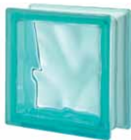
TURCHESE Q19 O 19x19x8