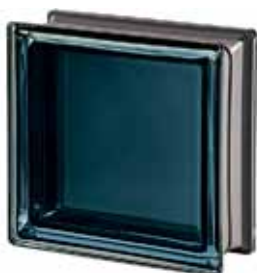
BLACK 30% Q19 T MET 19x19x8