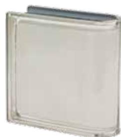
BIANCO TER LINEARE O MET 19x19x8