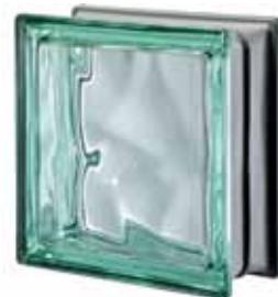
VERDE Q19 O MET 19x19x8