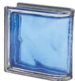
COBALTO TER LINEARE O MET 19x19x8