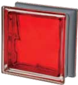
SCARLATTO Q19 O MET 19x19x8