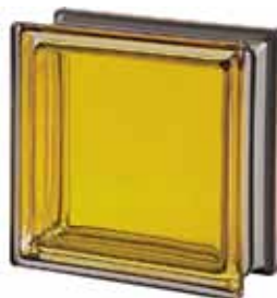
TOPAZIO Q19 T MET 19x19x8