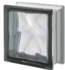
NORDICA Q19 O 19x19x8