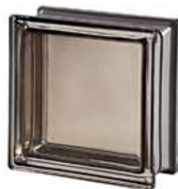
AGATA Q19 T MET 19x19x8