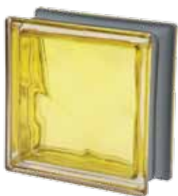
CEDRO Q19 O MET 19x19x8