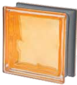
OCRA Q19 O MET 19x19x8