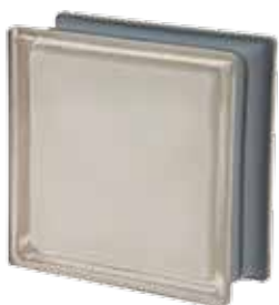
BIANCO Q19 O MET 19x19x8