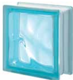
ACQUAMARINA Q19 O 19x19x8