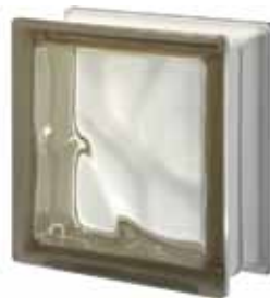
SIENA Q19 O 19x19x8