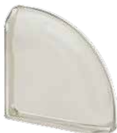
BIANCO TER CURVO O MET 19x19x8