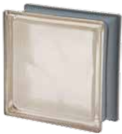
AVORIO Q19 O MET 19x19x8