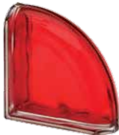
SCARLATTO TER CURVO O MET 19x19x8