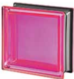
CORALLO Q19 T MET 19x19x8