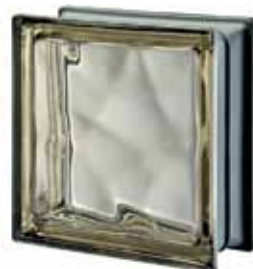
SIENA Q19 O MET 19x19x8