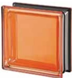
AMBRA Q19 T MET 19x19x8