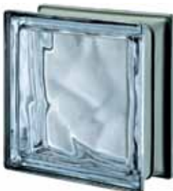
LILLA Q19 O MET 19x19x8