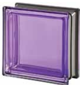
TORMALINA Q19 T MET 19x19x8