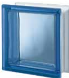
BLU Q19 T 19x19x8