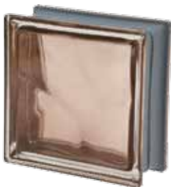
TORTORA Q19 O MET 19x19x8