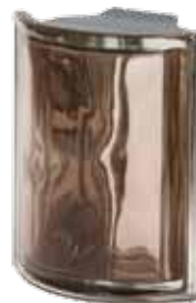
TORTORA ANGOLARE O MET 19x15,2x8