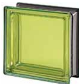
BERILLO Q19 T MET 19x19x8