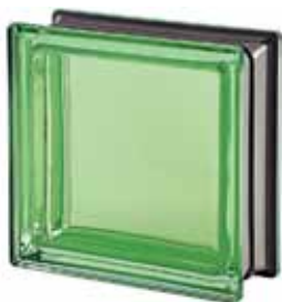
MALACHITE Q19 T MET 19x19x8