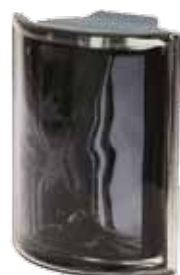
ARDESIA ANGOLARE O MET 19x15,2x8