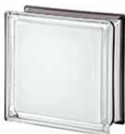
WHITE 100% Q19 T MET 19x19x8