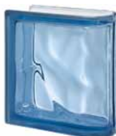
BLU TER LINEARE O 19x19x8