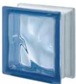
BLU Q19 O 19x19x8