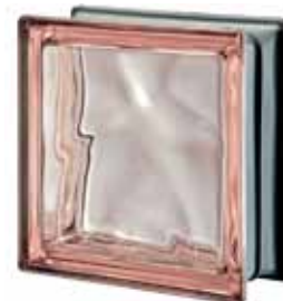
ROSA Q19 O MET 19x19x8