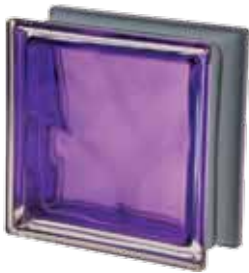
INDACO Q19 O MET 19x19x8