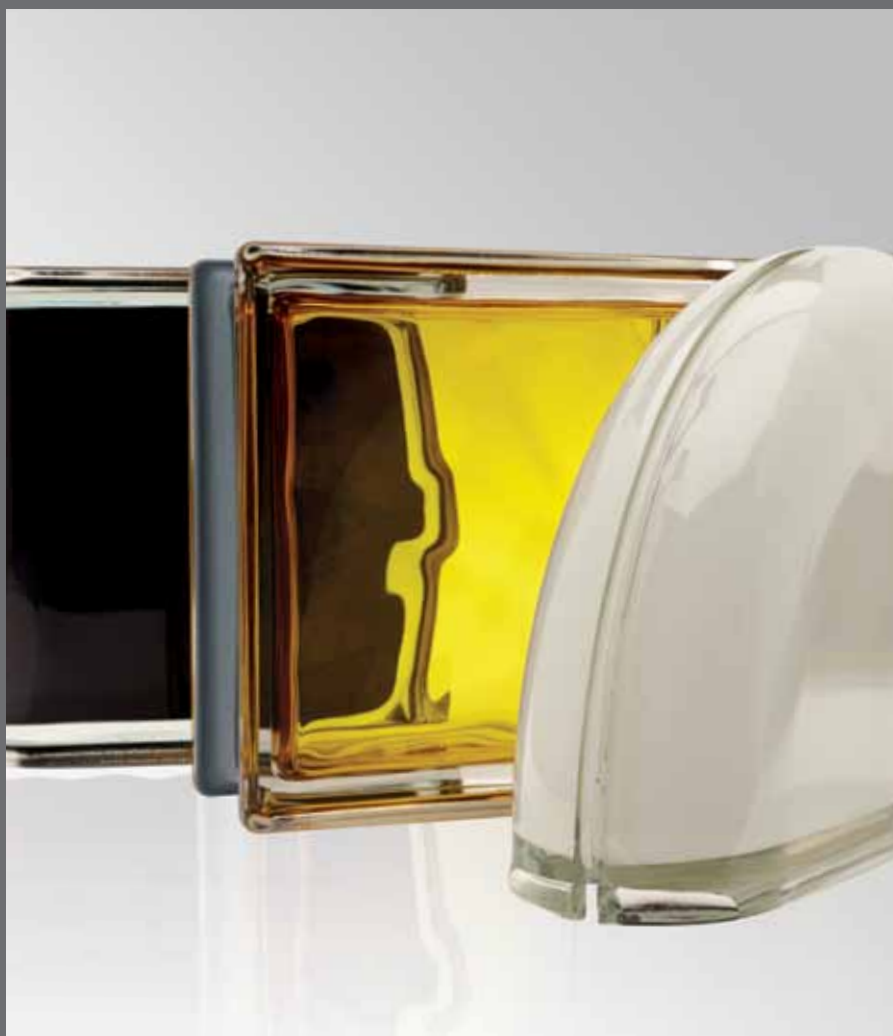
NEW COLOUR COLLECTION ORO Q19 O MET / BIANCO TER CURVO O MET / NERO Q19 O MET