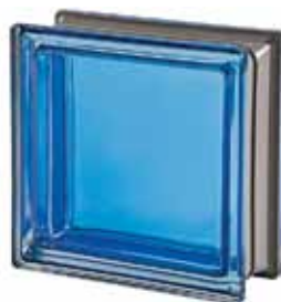
ZAFFIRO Q19 T MET 19x19x8