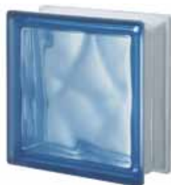
BLU Q19 O SAT 1 LATO 19x19x8