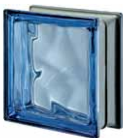
BLU Q19 O MET 19x19x8