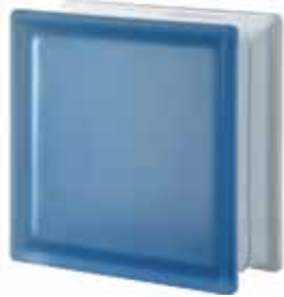
BLU Q19 T SAT 19x19x8