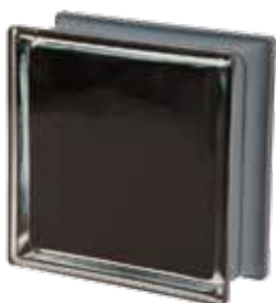
NERO Q19 O MET 19x19x8