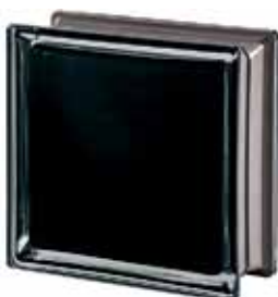
BLACK 100% Q19 T MET 19x19x8