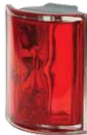
SCARLATTO ANGOLARE O MET 19x15,2x8