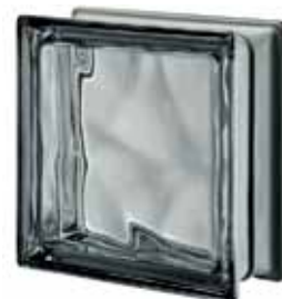
NORDICA Q19 O MET 19x19x8