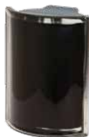
NERO ANGOLARE O MET 19x15,2x8