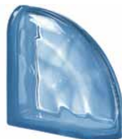
BLU TER CURVO O 19x19x8