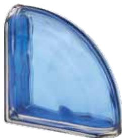
COBALTO TER CURVO O MET 19x19x8