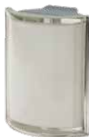
BIANCO ANGOLARE O MET 19x15,2x8