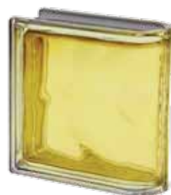
CEDRO TER LINEARE O MET 19x19x8