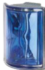
COBALTO ANGOLARE O MET 19x15,2x8