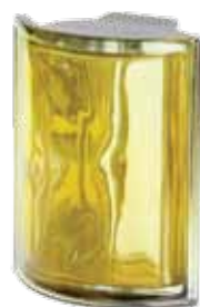
CEDRO ANGOLARE O MET 19x15,2x8