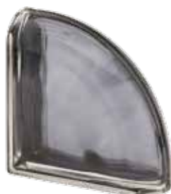
ARDESIA TER CURVO O MET 19x19x8