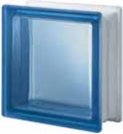
BLU Q19 T SAT 1 LATO 19x19x8