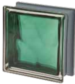
SMERALDO Q19 O MET 19x19x8